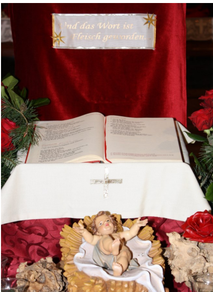
Weihnachtlich geschmückter Volksaltar in St. Gangulf Steinach

Wie in den letzten Jahren war die musikalische Begleitung wieder ein wesentlicher Bestandteil der Adventsmeditationen. Gerade die meditative Musik lud wieder wunderbar zur Besinnung und zur Reflexion ein. Besonderen Dank an dieser Stelle allen Musikern! Das Organisationsteam (Herr Dr. Ochs, Herr Dittebrand und Herr Hofmann) bedankt sich an dieser Stelle bei allen Mitwirkenden für ihre Unterstützung und bei allen Mitfeiernden für ihr reges Interesse. Schon jetzt möchten wir Sie auch in diesem Jahr zu den Adventsmeditationen an den vier Adventsamtagen einladen.