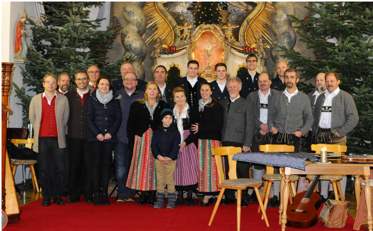
Die Mitwirkenden des Steindorfer Adventsingens